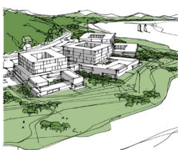
Akuttsjukehuset på Hjelset