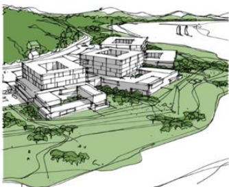
Akuttsjukehus på Hjelset