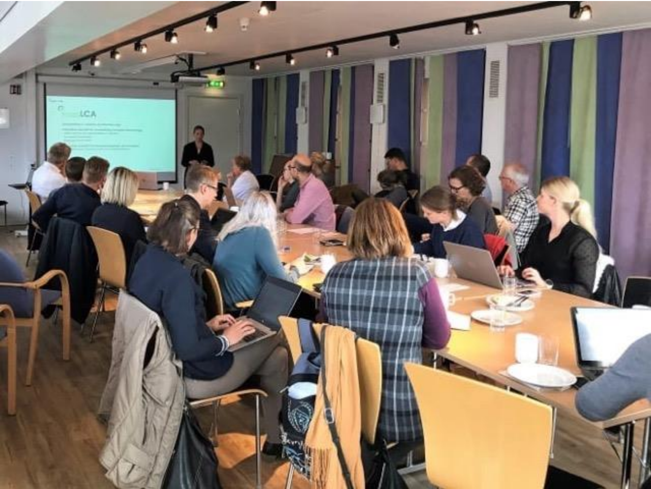
Byggeier-representanter på Grønt ekspertforum 19.9.19